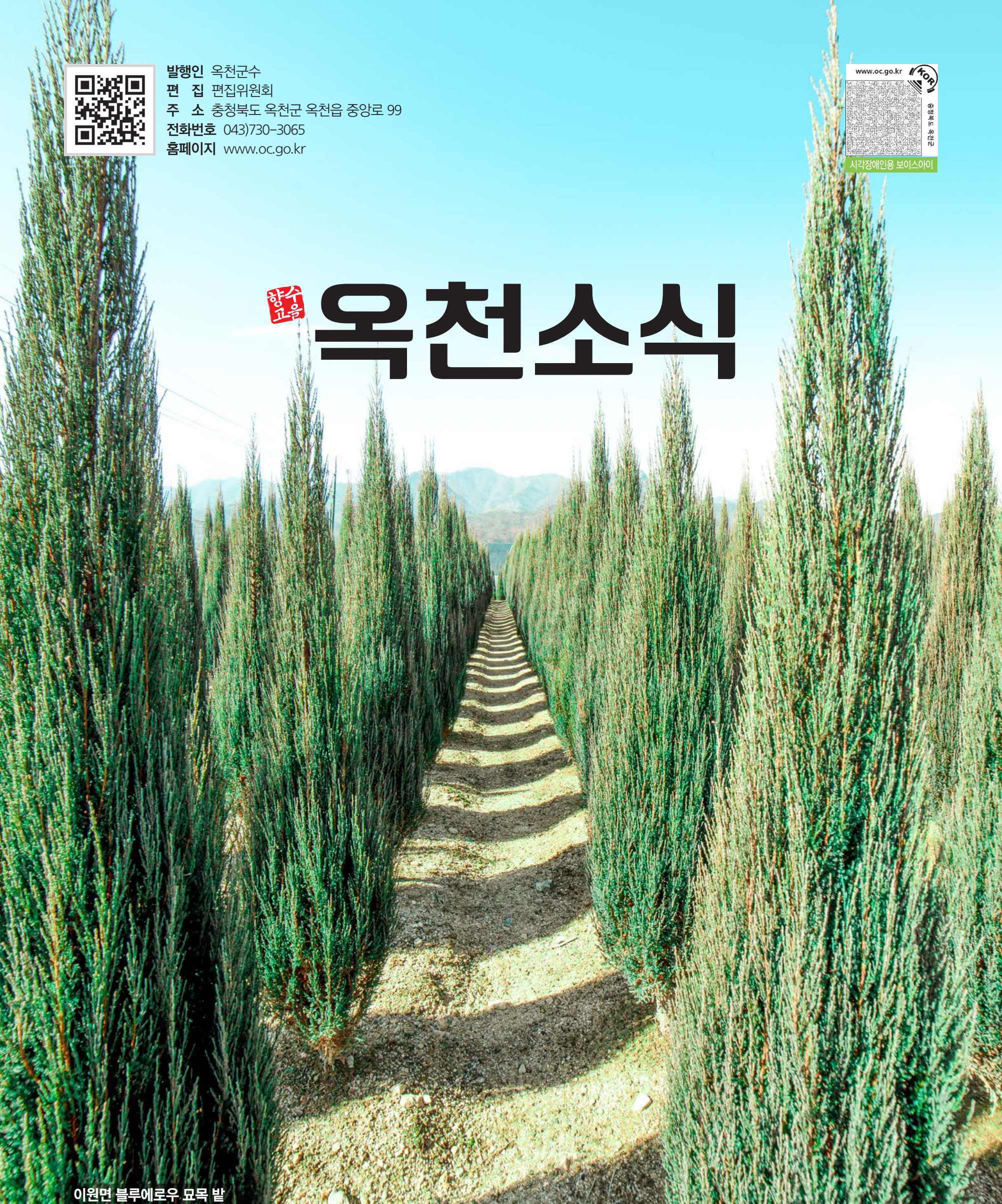
이원면 블루에로우 묘목 밭