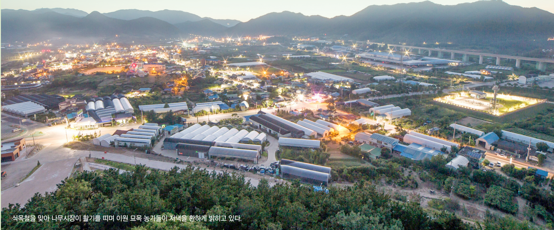
식목철을 맞아 나무시장이 활기를 띠며 이원 묘목 농가들이 저녁을 환하게 밝히고 있다.

옥천군은 과수 묘목 산업의 체질을 개선하고 건강한 묘목 유통 환경을 조성하기 위해 2019년부터 민간 주도의 옥천 묘목 향토산업을 육성하며 묘목 산업의 선진화를 주도해 왔다. 또한, 민간사업 주체인 옥천 묘목 향토산업 육성사업단은 무병묘 처리 시설과 공동 육묘장 조성, 신품종 연구 개발과 전문 인력 양성, 묘목 체험과 전시·판매 등 옥천 묘목의 6차 산업화에 힘쓰고 있다.