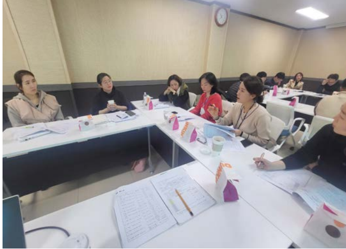
교사네트워크 옥천꿈지구 분과토론

작은학교 살리기 분과는 인근 학교 간 공동연구 및 공동교육과정 운영 방안을 집중 탐색했다. 마을의 특색을 반영하고 학생 한 명 한 명의 강점을