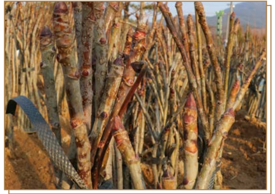
가시 없는 엄나무

오가피나무, 두릅나무, 엄나무, 헛개나무, 벌나무, 산수유나무, 참죽나무 등