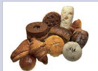
우리밀빵꾸러미 (농협회사법인 팜앤록 주식회사)