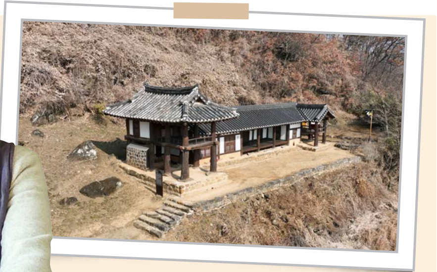
보물 제2107호 옥천이지당